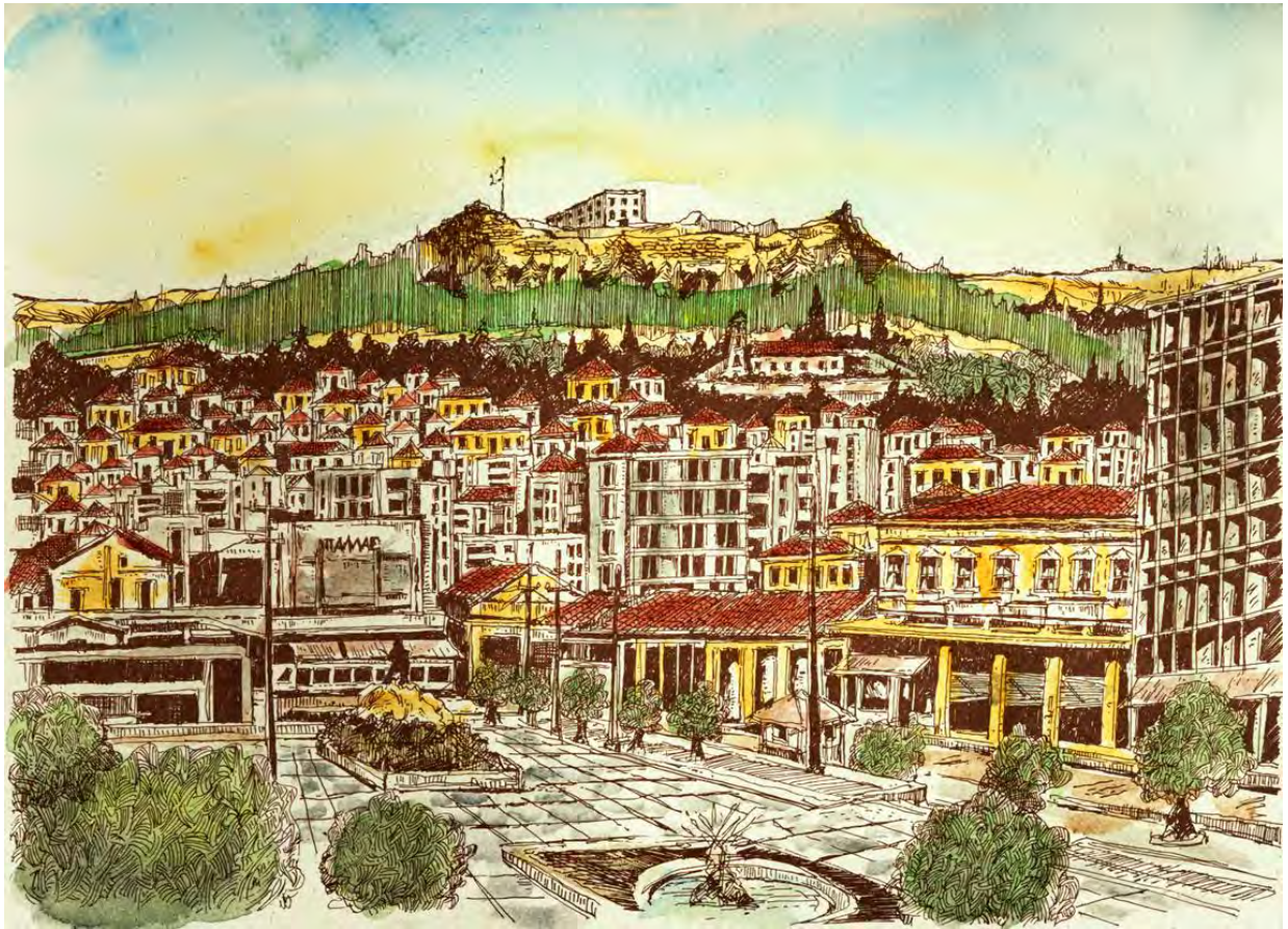
Η παλιά Λαμία (Δ. Κολτσίδας)